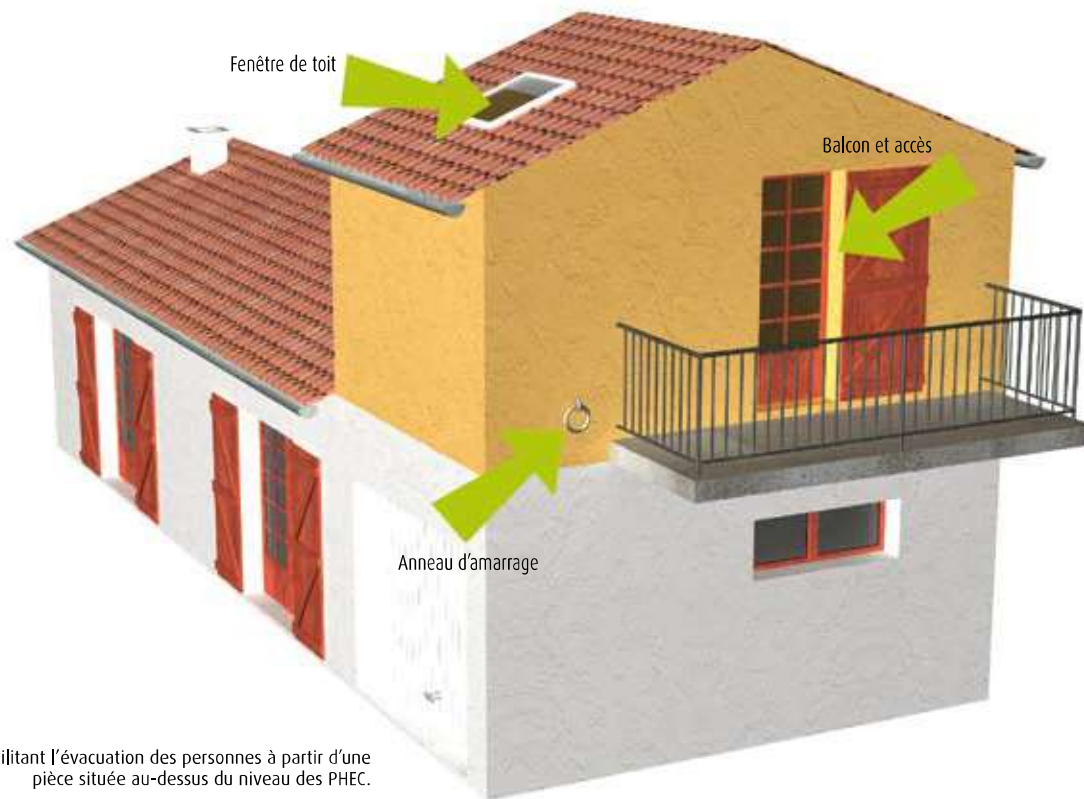
Dispositifs facilitant l'évacuation des personnes à partir d'une pièce située au-dessus du niveau des PHEC.

” Nota : Il conviendra de porter une attention particulière aux enjeux patrimoniaux et architecturaux (secteurs sauvegardés et prescriptions contraires des documents d'urbanisme, à titre d'exemples).