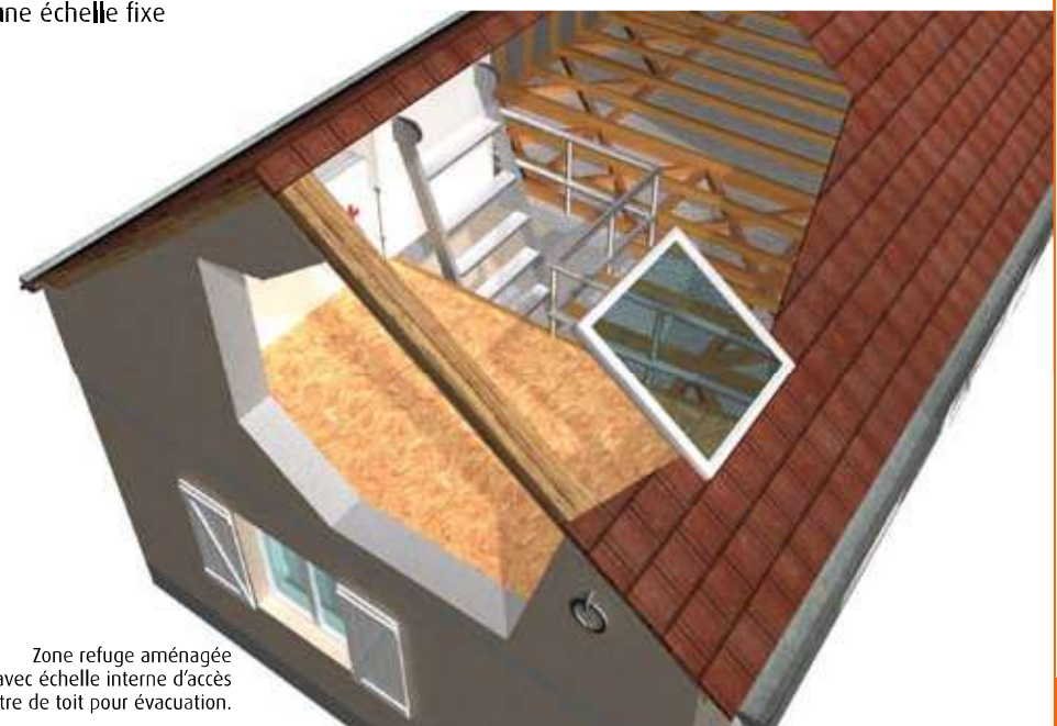
Zone refuge aménagée dans les combles avec échelle interne d'accès et fenêtre de toit pour évacuation.

Ministère de l'Égalité des territoires et du Logement Ministère de l'Écologie, du Développement Durable et de l'Énergie